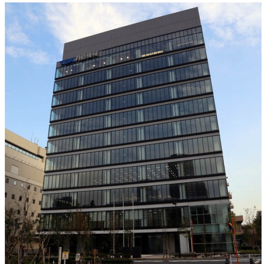
建物外観（黎明橋公園側から望む）

歩道状空地には、公共歩道とあわせて緑地が設けられ、街並みの連続性が確保されています。